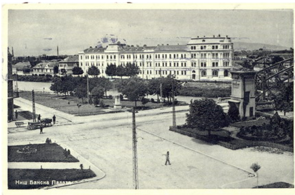
Зграда Бановине 1940. године

"Власт" колаборационистичке владе Србије простирала се на три крње бановине и то: Моравску са седиштем у Нишу, Дринску са седиштем у Ужицу и Дунавску са седиштем у Смедереву, те Управу града Београда. Таква Србија под немачком окупацијом обухватала је површину од 61.000 км 2 од приближно четири и по милиона становника.