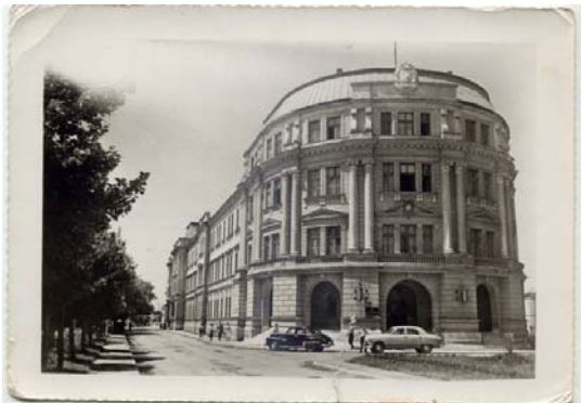
Зграда из времена када је предата Универзитету на коришћење

Петнаестог јуна 1965. године, донета је одлука о оснивању Универзитета у Нишу, који званично почиње са радом 1. септембра исте године. По оснивању Универзитета, цела зграда Нишког среза (Бановина) је била поклоњена Универзитету. У чеони део зграде, 1966. године, смештен је Ректорат, где се и данас налази.