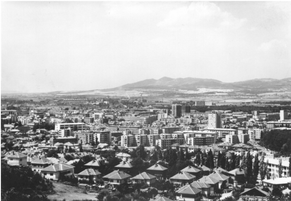
Ниш 1965. године.

2002. Оснива се Факултет уметности са три студијске опције - за ликовну, примењену и музичку уметност - које су у претходном периоду функционисале у оквиру Студијске групе за уметности Филозофског факултета.