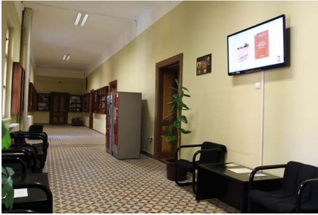
Главни ходник Библиотеке након реконструкције

заједнички су конкурисали са пројектом „Санација и опремање корисничког простора Универзитетске библиотеке «Никола Тесла» и Јединственог универзитетског научно-наставног информационог система Универзитета у Нишу (ЈУНИС)“, код Министарства просвете, а за средства из фондова Европске Уније за предприступну помоћ (ИПА пројекат).