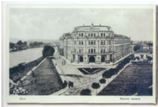
Зграда Бановине 1935. године