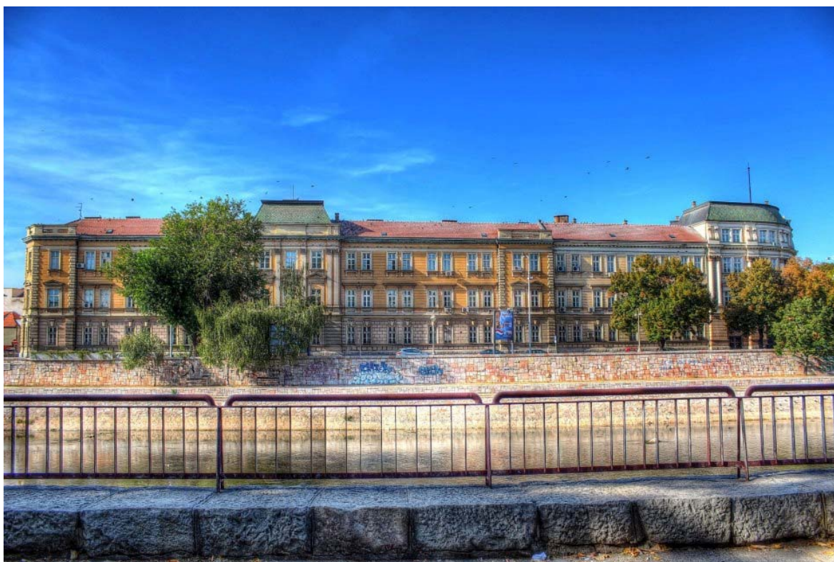
Зграда Универзитет у Нишу данас