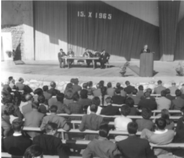
Иво Андрић говори професорима и студентима Универзитета, 15. октобра 1965. године, на летњој позорници у тврђави