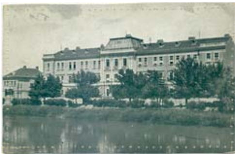
Фотографија зграде из 1930. године. Види се дограђен 2. спрат

По завршетку рата, зграда је и даље припадала Окружном начелству, под које је у то време осим нишког, потпадало још пет срезова. Повећање целокупног административног апарата довело је до потребе за проширењем канцеларијског простора у оквиру постојећег габарита ове зграде. Године 1925. дограђен је још један спрат. Приликом доградње се апсолутно водило рачуна не само о уклапању новог дела у постојећу архитектуру, већ и о њеном обједињавању у оквиру постојећег габарита у целини.